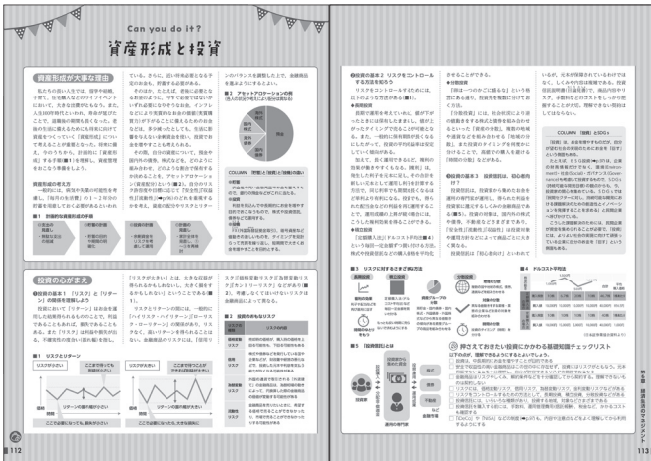
▲ p.112 - 113 第6章 経済生活のマネジメント Can you do it? 資産形成と投資

生涯を通して確かな生活を築くために必要な経済計画について、資産形成と投資を軸に多面的・具体的に取り上げたページを設け、金融教育の充実をはかりました。